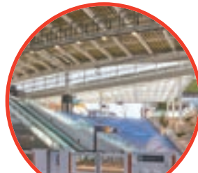
南町田グランベリーパーク