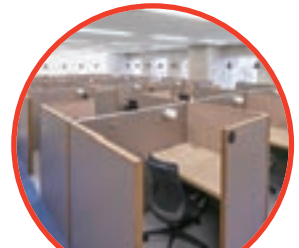
サテライトシェアオフィス (NewWork)