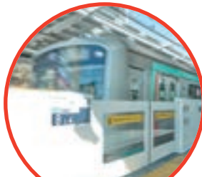
ホームドアの設置